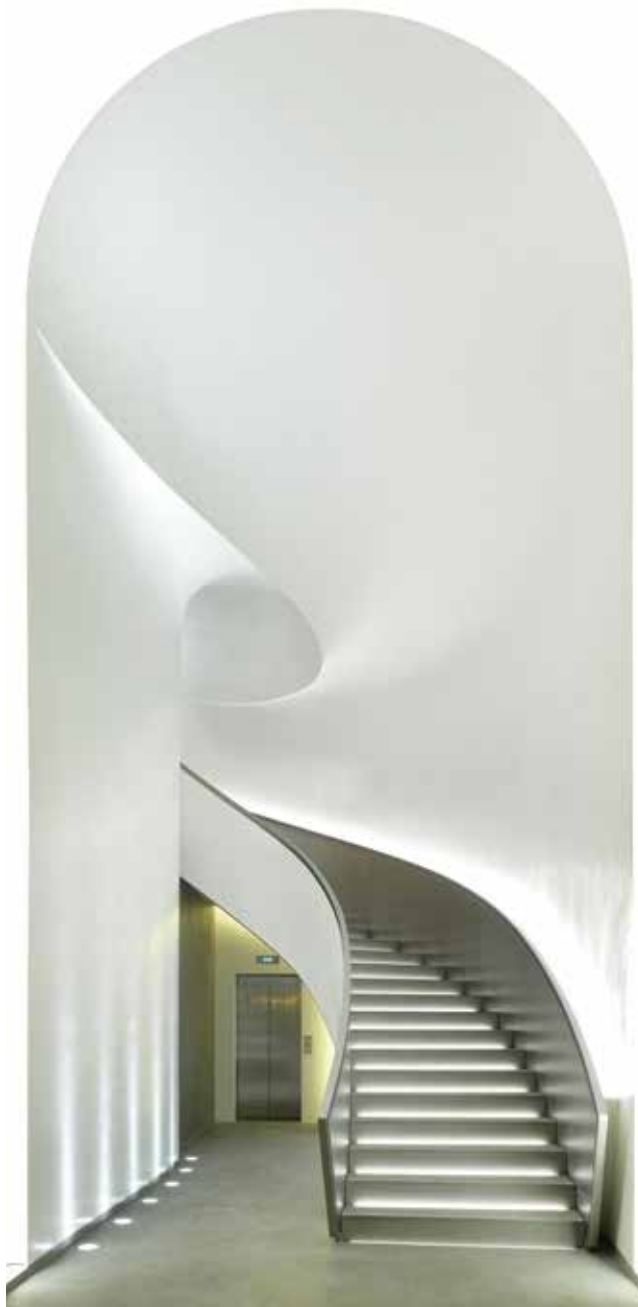
↑ Grand escalier du hall d'entrée d'un immeuble de bureau au 92 avenue des Champs-Élysées, Paris. Plus qu'une entrée, c'est un objet sculptural monochrome réalisé dans un plâtre minéral spécifique et inédit dont la dureté approche celle du marbre.

Ainsi nos premiers pas, il y a quelques décennies, sur le recyclage de matériaux pour l'un, et l'expérimentation sur la matière alimentaire pour l'autre.