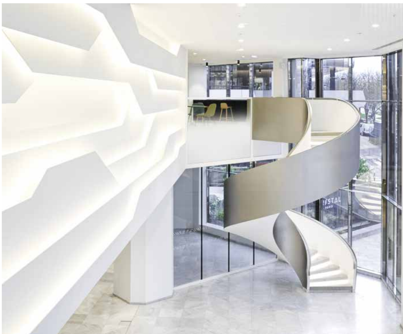
↑ Hall d'accueil de la tour « Cristal Paris », Paris 15 e , architectes Julien Penven et Jean-Claude Le Bail. Au premier plan : fresque lumineuse en bas-relief (15 m de longueur par 3 m de hauteur) réalisé en lames de staff juxtaposées les unes aux autres. Un dispositif électrique invisible est installé à l'arrière des plaques pour une diffusion uniforme de la lumière. Au second plan : grand escalier à double révolution autoportant formant un ruban d'un seul tenant d'acier et de pierre.

Si nous devons rêver une agence parfaite, nous aimerions emmener ce nouveau monde vers une réflexion « global local », et envisager un meilleur contrôle de la pérennité et du circuit de recyclage des matériaux.